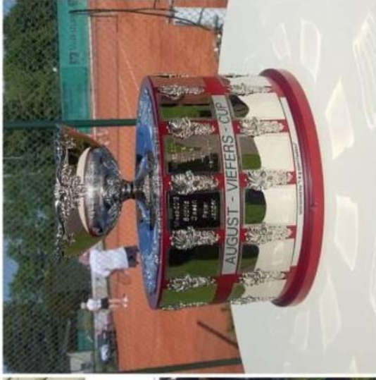
Die Turnierleitung geht ins 6. Jahr August Viefers Cup 2018